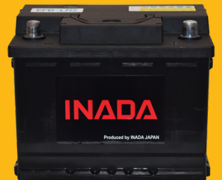
低抵抗エンベロープ セパレーター